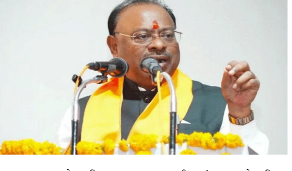
कामाच्या व्यापामुळे आणि बदलत्या गरजांमुळे हा निर्णय घेण्यात आला. यापूर्वीचा आकृतीबंध २००६ मध्ये निश्चित करण्यात आला होता. नव्या आराखड्याला उच्चस्तरीय समितीने

राज्यातील महसूल प्रशासन अधिक सक्षम, जल्द आणि लोकाभिमुख करण्यासाठी शासनाने मोठा निर्णय घेत महसूल विभागाचा सुधारित आकृतीबंध मंजूर केला आहे. तब्बल वीस वर्षांनंतर करण्यात आलेल्या या बदलामुळे विभागाच्या रचनेत व्यापक फेरबदल होणार आहेत. या नव्या आराखड्यानुसार एकूण ३५ हजार ८७६ पदांना मंजुरी देण्यात आली असून, मुद्रांक, भूमी अभिलेख आणि महसूल या तिन्ही विभागांचा समावेश करण्यात आला आहे. गेल्या दोन दशकांत वाढलेल्या