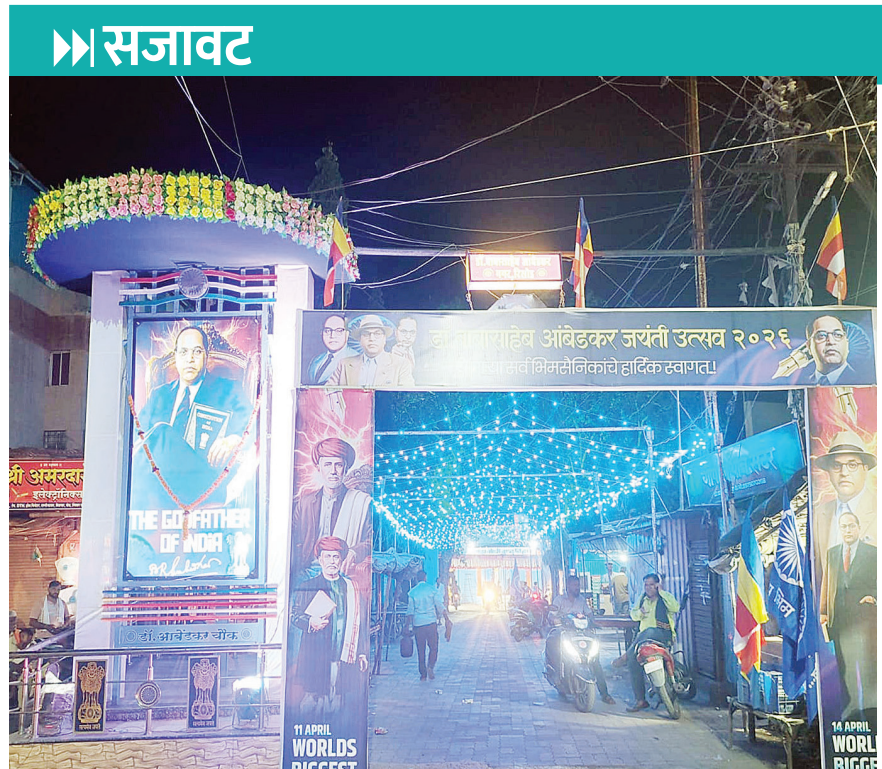
रिसोड शहरातील डॉ. बाबासाहेब आंबेडकर नगर येथील डॉ. बाबासाहेब आंबेडकर जयंती निमित्त RA-1 मित्र मंडळाच्या वतीने सुंदर सजावट करण्यात आली