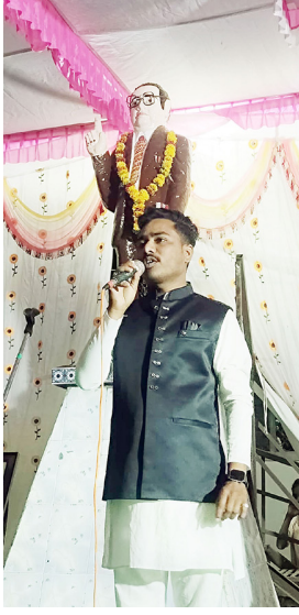
शिक्षणाची दारे खुली करून त्यांना

बाबासाहेब आंबेडकर यांनी महिला, कामगार, विद्यार्थी, समाजातील प्रत्येक घटकासाठी काम केले, व बहुजनांसाठी