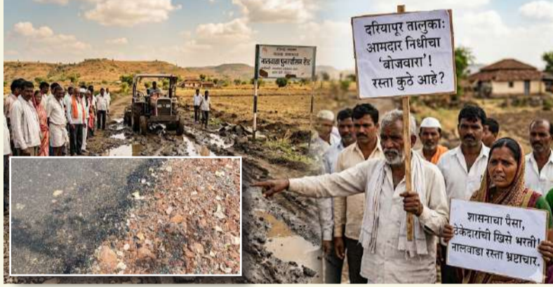
दर्यापूर तालुक्यात भ्रष्टाचाराची 'साखळी'? नालवाडा हे केवळ एक प्रातिनिधिक उदाहरण आहे.

'मेहेरबानी' सुरू आहे, असा प्रश्न आता सर्वसामान्य जनता विचारत आहे. नालवाडा बस स्टॅंड ते पुनर्वसन या रस्ता बांधकामासाठी २५ लाख रुपयांचा निधी मंजूर करण्यात आला होता. जिल्हा परिषद विभागामार्फत हे काम पूर्ण झाल्याचे दाखवण्यात आले. मात्र, प्रत्यक्ष कामाची पाहणी केली असता, तांत्रिक नियमांना पूर्णपणे हरताळ फासल्याचे दिसून येते. डांबरीकरण केल्यानंतर रस्त्याच्या दोन्ही बाजूंना खडी आणि मातीच्या 'साईड पट्ट्या' भरणे अनिवार्य असते, जेणेकरून अपघात टाळता येतील. मात्र, येथे साईड पट्ट्यांचा पत्ताच नाही! रस्त्याचा दर्जा इतका निकृष्ट आहे की, २५ लाखांपैकी केवळ १० ते १२ लाख रुपये खर्च करून उर्वरित रकमेवर ठेकेदार आणि संबंधित अधिकाऱ्यांनी डल्ला मारल्याचे चित्र स्पष्ट दिसत आहे.