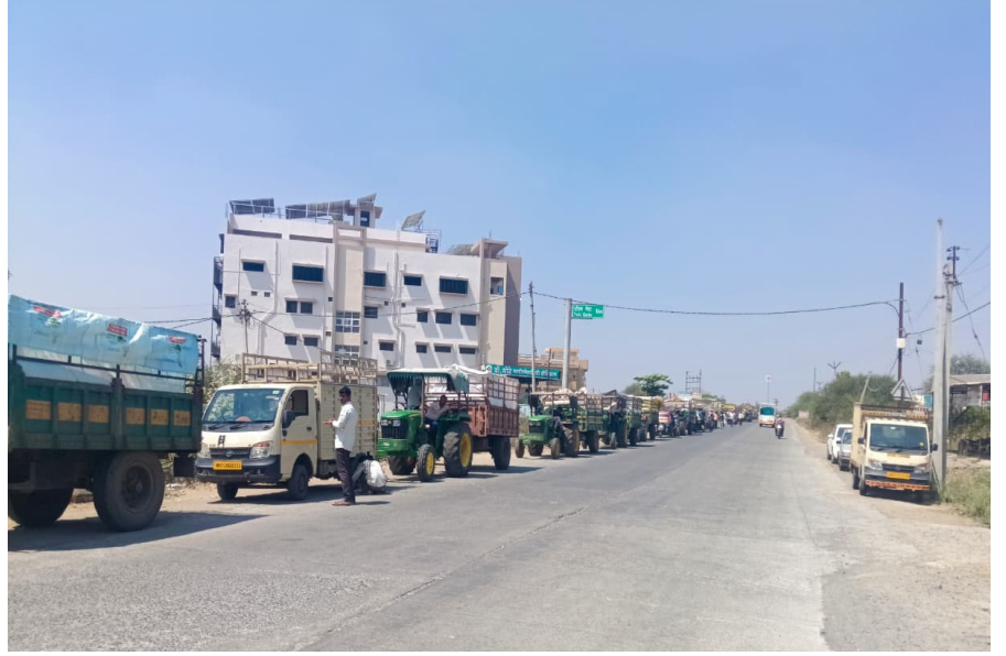
उपबाजार समिती शेलुबाजार येथे गहू, हरभरा या पिकाची आवक वाढल्यामुळे जवळपास एक किलोमीटर अंतरापासून शेतकऱ्यांचे मालाचे ट्रॅक्टरांची रांग पाहायला मिळत आहे...!