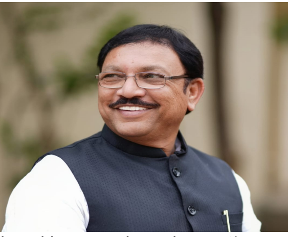
आहेत. त्यामुळे केंद्र व राज्य सरकारने या योजनेची प्रभावी अंमलबजावणी करून शेतकऱ्यांना आर्थिकदृष्ट्या सक्षम करणे अत्यंत गरजेचे आहे,