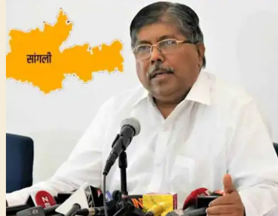
म्हातारपण सुखरूप जाईल असा विश्वास वाटतो, असे ते म्हणाले. त्यांचे हे विधान ऐकून उपस्थितांत एकच हशा पिकला.