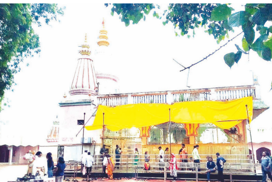
यात्रे करीता ज्यत्त तयारी केली आहे. यावेळी दि २ ते ६ फेब्रुवारी सोमवार ते शुक्रवार रात्री ८ ते १० पर्यंत हनुम गोपाळ महाराज उरळ, शुभम महाराज आखरे खिरपुरी, गजानन महाराज महाराज ग्रंथाचे पारायण हनुम रामकृष्ण

बाळापूर : पातूर तालुका पंचक्रोपीतील दिग्रस बु. येथे सोपीनाथ महाराज संस्थान च्या वतीने किर्तन व भजन सप्ताह तसेच दोन दिवसीय यात्रा महोत्सवाचे भव्य दिव्य आयोजन दि ६ व ७ फेब्रुवारी रोजी करण्यात आले असून, दि २ फेब्रुवारी सोमवार रोजी देवांचे लन व सायंकाळी ६ वाजता महाप्रसादाचे आयोजन करण्यात आले आहे. यावेळी संस्थानचे विश्वस्थ संचालक मंडळ तसेच गावकरी यांनी देवांचे लन सोहळा तथा भव्य दिव्य महाप्रसाद, सप्ताह तसेच