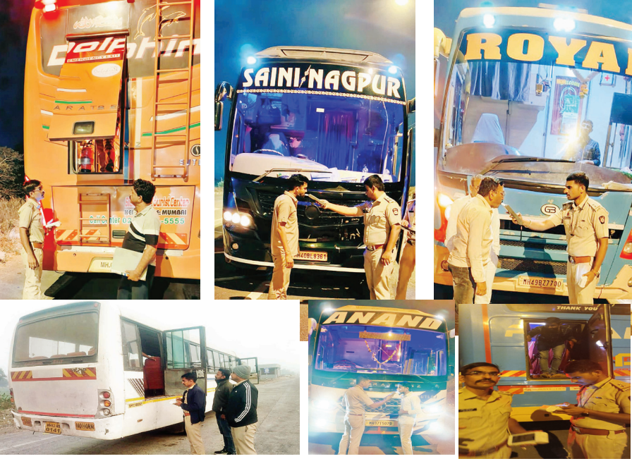
खासगी प्रवासी बसांची तपासणी करण्यात येत असून आतापर्यंत ४८ खासगी बसेसवर मोटार वाहन कायदा व संबंधित नियमानुसार कारवाई करण्यात आल्याची माहिती देण्यात आली आहे.

■ या संदर्भातील वृत्त 'विदर्भ केसरी' मध्ये प्रसिद्ध झाल्यानंतर परिवहन विभागाने तातडीने दखल घेत तपासणी मोहीम अधिक व्यापक स्वरूपात राबविण्यास सुरुवात केली असून ही कारवाई पूर्णतः प्रवाशांच्या सुरक्षिततेच्या दृष्टीने असल्याचे अधिकाऱ्यांकडून स्पष्ट करण्यात आले आहे.