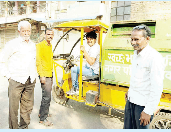
त्यांच्या तक्रारी जाणून घेतल्या. विशेष म्हणजे यवतमाळ

नगरपालिकेवर प्रशासक राज संपून भारतीय जनता पार्टीची सत्ता स्थापन होऊनही शहर स्वच्छ व सुंदर होण्याऐवजी अस्वच्छतेकडेच वाटचाल सुरू असल्याचे स्पष्ट होत आहे. कचरा संकलनाचा ठेका मिळालेल्या ठेकेदारांवर नगरपालिकेचा कोणताही प्रभावी अंकुश नसल्याचा आरोप यावेळी करण्यात आला. ठेकेदारांकडून कामगारांची नियमित उपस्थिती,वेळापत्रकानुसार कचरा उचल,ई-रिक्षांचे रोजचे फेरे,गणवेश व ओळखपत्रांची