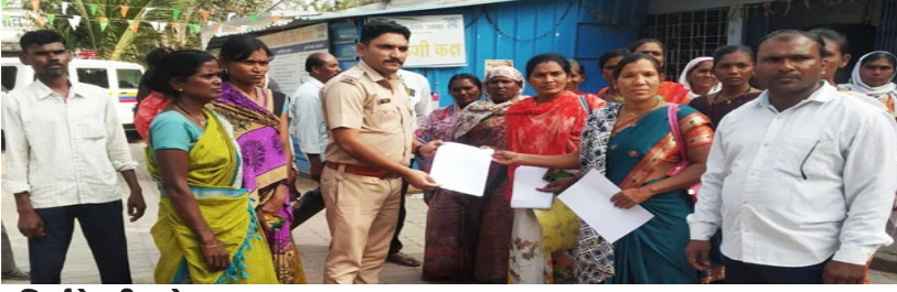
विदर्भ केसरी। राळेगाव,

राळेगाव पोलिस ठाण्यांतर्गत सावनेर येथे बस स्टॉप परिसर व वाढोणा रोडलागत दिवसरात्र राजरोसपणे अवैध दारू विक्री सुरू आहे. याचा महिलेला त्रास होत आहे. तसेच गावातील सामाजिक शांतता धोक्यात आली आहे. त्यामुळे गावातील दारूविक्री कायमस्वरूपी बंद करण्यासाठी सावनेर येथील सरपंच, ग्रामपंचायत