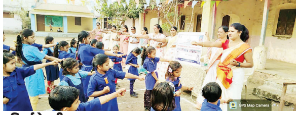
विदर्भ केसरी। यवतमाळ -

इतिहास घडवणाऱ्या या क्रांतिकारी पावलात, महाराष्ट्र शिक्षण परिषद मंडळ ( MPSP ) रानी लक्ष्मीबाई आत्मरक्षण प्रशिक्षण कार्यक्रमांतर्गत यवतमाळ जिल्ह्यासह महाराष्ट्र भरताले सुमारे १५ लाख मुलींना प्रशिक्षण देऊन विश्वविक्रम प्रस्थापित करणार आहे. माननीय मंत्री दादासाहेब भुसे यांच्या दूरदर्शी नेतृत्वाखाली राबवल्या जाणाऱ्या या महत्त्वाकांक्षी उपक्रमामुळे राज्यभरातील मुलींच्या सशक्तीकरण आणि सुरक्षेत