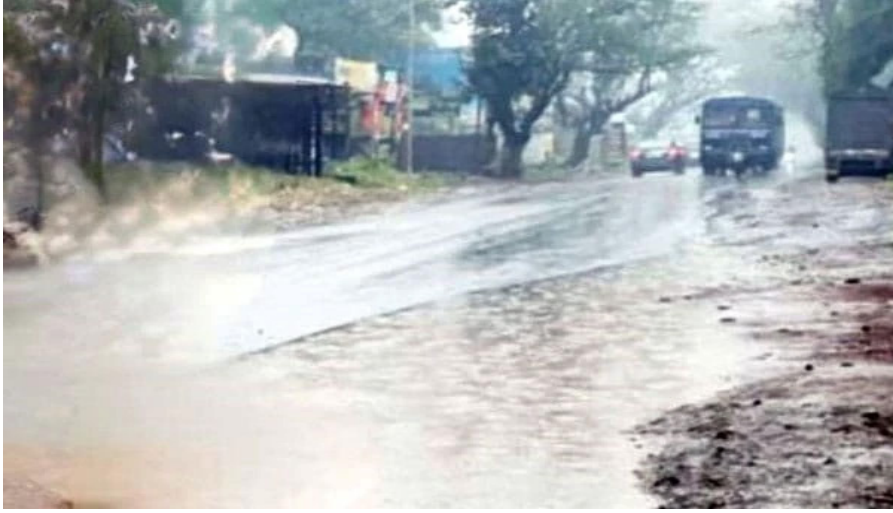
पावसामुळे शेतकऱ्यांचे गहू, मिरची, चना, मूंग, भाजीपाला आदी पिकांचे नुकसान होण्याची शक्यता वर्तविण्यात येत आहे.