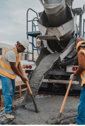
शासकीय निधीचा योग्य वापर व्हावा आणि काम दीर्घकाळ टिकावे, यासाठी ही पारदर्शक पद्धत अवलंबणे अत्यंत आवश्यक असल्याने नांदगाव खंडेश्वर नगर पंचायत अंतर्गत होणारे विकास कामे रस्ता / नाली कामासाठी मिक्सरद्वारे काँक्रीट माल बनविण्याची प्रक्रिया स्थानिक नागरिकांच्या व लोकप्रतिनिधीच्या नजरेसमोर करण्याची मागणी

नांदगाव खंडेश्वर नगर पंचायत अंतर्गत होणारे विकास कामादरम्यान, काँक्रीटचा माल (काँक्रीट मिक्स) हाताने/मॅन्युअली न बनवता. कामात पारदर्शकता (transparency) यावी आणि काँक्रीटचे योग्य प्रमाण (proper ratio of concrete) वापरले जावे, यासाठी मिक्सरचा वापर केला जात असताना सर्व काँक्रीटचा माल हा केवळ आणि केवळ काँक्रीट मिक्सर मशीनद्वारेच (concrete mixer machine) बनवण्यात यावा. माल बनवण्याच्या संपूर्ण प्रक्रियेदरम्यान स्थानिक नागरिक, प्रभागातील लोकप्रतिनिधी नगराध्यक्ष, सभापती, नगरसेवक, नगरसेविका, आणि जागरूक कार्यकर्त्यांना हजर राहण्याची परवानगी द्यावी, जेणेकरून कामाची गुणवत्ता सुनिश्चित करता येईल.