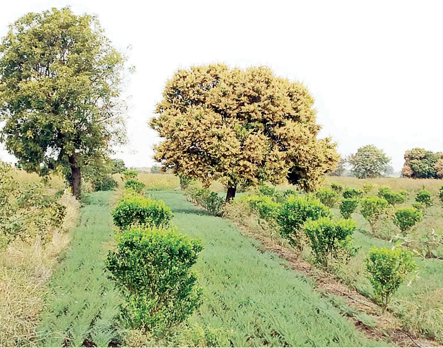
मंगरूळपीर, तालुक्यातील सोनखास परिसरात...मोहराने बहरला आंबा... मात्र ढगाळ वातावरणामुळे शेतकऱ्यांची चिंता वाढली सर्वदूर आंभराई बहरल्या आणि अशात गारपीट झाली तर संपूर्ण मोहर जळून जाण्याची भीती शेतकरी करत आहे.....