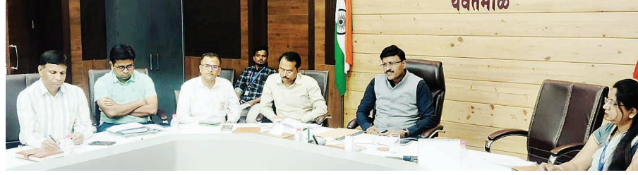
पॅकेज दरवाढ करताना सुवर्णमध्य साधण्यासाठी सर्वजनिक आरोग्य विभाग, वैद्यकीय शिक्षण विभाग, खासगी रुग्णालये तसेच खासगी वैद्यकीय महाविद्यालयांच्या प्रतिनिधींची संयुक्त समिती स्थापन करण्यात आली आहे. केंद्र व राज्य सरकारच्या एकत्रित योजनेअंतर्गत माननीय मुख्यमंत्र्यांनी पाच लाख रुग्णांपर्यंतच्या उपचारांची जबाबदारी या समितीवर सोपवली असून त्याची प्रभावी अंमलबजावणी सुरू आहे.

राज्यातील सर्वजनिक व खासगी रुग्णालयांतील उपचार पॅकेजचे दर अनेक वर्षांपासून न बदलल्याने रुग्णांकडून अतिरिक्त शुल्क आकारले जात असल्याच्या तक्रारी वाढल्या होत्या. त्यामुळे सर्वसामान्य नागरिकांना मोठ्या आर्थिक अडचणींना सामोरे जावे लागत होते. या पार्श्वभूमीवर केंद्र शासनाची आयुष्मान भारत-प्रधानमंत्री जन आरोग्य योजना आणि महाराष्ट्र शासनाची महान्या च्योतिराव फुले जन आरोग्य योजना यांची एकत्रित व प्रभावी अंमलबजावणी करण्यासाठी महाराष्ट्र शासनाचे महत्त्वाचे व दूरगामी निर्णय घेतले आहेत.