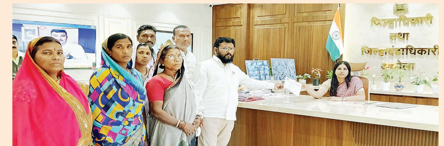
धेऊन वन्यप्राण्यांमुळे होत असलेल्या नुकसानीची वस्तुस्थिती प्रशासनासमोर मांडली. जिल्ह्यातील ग्रामीण भाग व सातपुडा पायथ्यालगतच्या परिसरात रानडुकर, नीलगाय, हरण, वानर

शेतकरी संघटनेचा जिल्हाधिकारी कार्यालयावर हल्लाबोल नरकाळा महोत्सव बहिष्काराचा शेतकरी संघटनेचा इशारा,