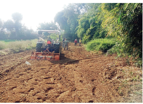
कावडे उभे राहण्यासाठी मोठ्या अडचणीचा सामना करावा लागत होता. त्या अनुषंगाने वाडेगाव येथील

बाळापूर : स्मशानभूमी परिसरात स्वखर्चाने स्वच्छता अभियान राबविण्यात आले असल्याने नागरिकांकडून कौतुकास्पद प्रतिक्रिया व्यक्त करण्यात येत आहेत. बाळापूर तालुक्यातील वाडेगाव येथील नदी काठावरील नळ योजनेच्या विहिरीजवळील असलेल्या स्मशानभूमी परिसरात आजमितीला मोठ्या प्रमाणात गांजर गढतासह इतर काटेरी झाडे गुड्यांचे साम्राज्य मोठ्या प्रमाणात पसरले होते. परिणामी अंत्यविधीसाठी गेलेल्या नागरिकांना बसण्यासाठी