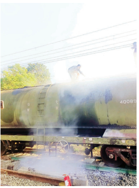
आगीचे नेमके कारण अद्याप समजू शकलेले नाही. विशेष म्हणजे, एवढी मोठी घटना घडूनही रेल्वे प्रशासनातील वरिष्ठ अधिकार्यांनी यावर अधिकृत प्रतिक्रिया देण्यास नकार दिला आहे. त्यामुळे शाईट सर्किटमुळे आग लागली की अन्य काही तांत्रिक विघाड होता,

असल्याने आगीचा भडका उडण्याची भीती निर्माण झाली होती. घटनेची माहिती मिळताच स्टेशनवरील रेल्वे कर्मचाऱ्यांनी धाव घेत अग्निशामन उपकरणांच्या मदतीने आग विझवण्याचे काम युद्धपातळीवर सुरू केले. शहरावरील मोठे संकट टळले रेल्वे स्थानकाचा परिसर लोकवस्तीला लागून असल्याने ही आग पसरली असती किंवा वॅगनचा स्फोट झाला असता, तर मुर्तिजापूर शहरात मोठी जीवितहानी आणि वित्तहानी झाली असती. मात्र, कर्मचाऱ्यांनी जीवाची पर्वा न करता वेळीच केलेल्या कारवायामुळे मोठा अनर्थ टळला. या घटनेत सुदैवाने कोणतीही जीवितहानी झाल्याचे वृत्त नाही. प्रशासनाचे मौन आणि संग्रम