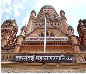
निश्चित करण्यात आले आहेत. यामध्ये शाळा, महाविद्यालयांसह शासकीय / निमशासकीय इमारती, सहकारी गृहनिर्माण संस्था तसेच खासगी इमारतीचा समावेश आहे. प्रत्येक प्रभागातील लोकसंख्या, मतदारांची संख्या आणि भौगोलिक परिस्थिती

बृहन्मुंबई महानगरपालिका सार्वत्रिक निवडणूक २०२५-२६ साठी महानगरपालिका प्रशासनाने ज्यत्त तयारी केली आहे. लोकशाहीच्या या महत्त्वाच्या प्रक्रियेत प्रत्येक मतदाराला मतदानाचा हक्क सुलभपणे बजावता यावा, यासाठी महानगरपालिका आणि निवडणूक यंत्रणेने सूक्ष्म नियोजन केले आहे. या निवडणुकीत एकूण १ कोटी ३ लाख ४४ हजार ३१५ मतदार मतदानाचा हक्क बजावणार आहेत. त्यांच्यासाठी विविध ठिकाणी मिळून एकूण १० हजार २३१ मतदान केंद्र