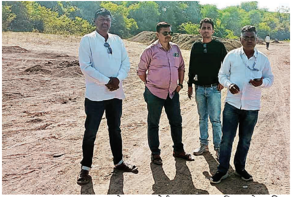
अचलपूर तालुक्यात गेल्या चोरीच्या घटना व विनापासेस कीवा क्षमते अधिक गौनखनिज वाहतूक

महसूल विभागाने रती चोरी व विना पासेस गौण खनिजाची वाहतूक करणाऱ्यां विरोधात मोहीम उघडली आहे. विविध पथके स्थापीत केले असून दिवसासह रात्री उशीरापर्यंत वाहनचालकांकडून रायलट्टी तपासणी करण्यात येत आहेत. व विनापासेस असलेल्या वाहनावर कारवाया केल्या जात असल्याचे चित्र आहे.